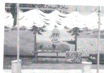
Ativações de 2022 no palco 1.